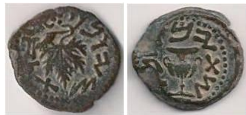
Fig 1. Coin "Year two" qualitative level

מטבעות הכסף שהוטבעו בכל אחת משנות המרד בוצעו ברמות איכות גבוהה ואחידה במיוחד מאחר ותכולת הכסף בהם הייתה רבה מהרגיל, לערך 98% תכולת כסף צרוף, נועדה לקיום המצווה הזו כלשונה. ניתן להניח שטביעתם של מטבעות כסף אלה, שכללו 2 ערכים: חצי שקל ושקל, נעשתה כחלק בלתי נפרד מפעילות שלטונות בית המקדש ובפיקוחם, בכדי שהשימוש בהן יעשה כדין. יצרני הגלופות וכן עובדי המטבעה, נדרשו לייצר את המטבעות באיכות גבוהה מאד ובהתאמה לאסימוני המטבעות. החלפנים, שהתמקמו בקרוב מקום לכניסה למקדש, אלה פעלו להמיר מטבעות וכספים של עולי רגל מקרב תושבי הארץ ואחרים שהגיעו מהתפוצות ולהתאים בשווה ערך למטבעות השקלים מכסף. ניתן להניח שגם פעילותם נעשתה בפיקוח שלטונות המקדש. להצביע על כך שטביעות השקלים של המרד באו כחלופה למטבעות שקלים מצור באותם ערכים, אשר שמשו לפני כן לתרומות למקדש ואשר פסקו להופיע במחזור באותה עת.