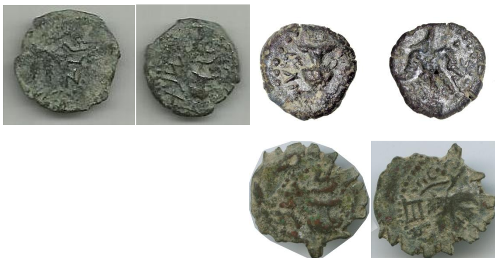
מצבי איכויות בטביעת מטבעות המרד הגדול נגד הרומאים

בסופו של דבר המצב הסופי של המטבעות מארד בממצא של מטבעות המרד הגדול נגד הרומאים מתקופה זו היה : א). רמת תקן בפועל נמוכה, שכלל לא נדרשה כסטנדרט. ב). מצב המטבע בהתאם למשך השימוש במטבע במחזור בתקופת המרד. ג). התנאים בהם המטבע השתמרה, לאחר שיצאה מכלל שימוש.