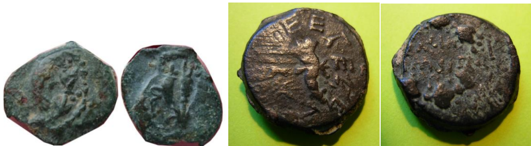
Fig 7. Coins of Antigonos

פגם נוסף במטבעות מתתיה אנטיגונוס הוא הרכב של כ 27% ממוצע עופרת בתכולת המטבעות, גורם שהביא לבליה רבה יותר בהשתמרות המטבעות. יחד עם זאת טיב המטבעות ברוב הממצא הוא ירוד מאד.