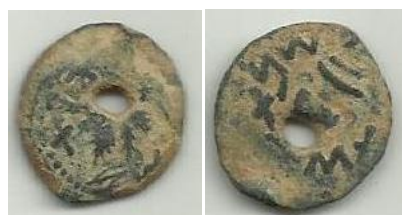
Fig 2. Low quality level coin "Year two"

המחבר טוען שרובם של המטבעות במחזור היו ברמות בינוניות ומטה זאת על פי סריקה במהלך השנים, של מטבעות רבים מתקופת המרד הגדול. ניתן לומר שניתן לסווג בטיבם ובמצב שימורם את רוב המטבעות שהיו במחזור בירושלים לרמה בינונית. מהמצב משתמע שתושבי ירושלים לא בחלו להשתמש גם במטבעות באיכות נמוכה, במטבעות פגומות ואחרים שהיו במצבים לא תקינים. במהלך המרד, הכלכלה בירושלים פעלה ככלכלה סגורה. והמחבר יציג בהמשך דוגמאות ממטבעות אלה, כאשר את רובם מאפיינים פגמים שנוצרו בתהליך הטביעה, בהם טביעות כפולות, סדקים וחתכים כתוצאה מתהליכי הטביעה במטבעת העיר (Zlotnik 2012:81-92) ומטבעות שנפגמו בשריפה (Bijovsky 2009:73-81). זו הייתה המציאות הנומיסמטית באותה עת.