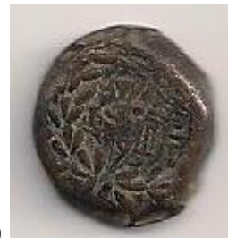
משורר ש 32